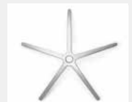
FHAEG Aluminium poliert (Option) Aluminium polished (option)