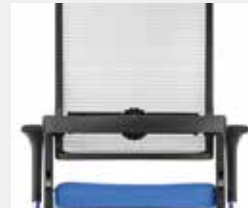
Schwarz (RAL 9011) Black (RAL 9011)