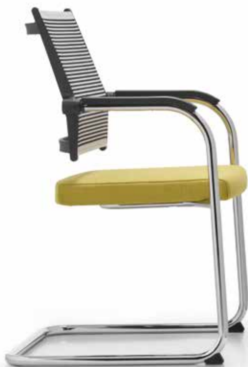
LO 3315 Armauffagen (PU) | Armpads (PU) AA03KGS