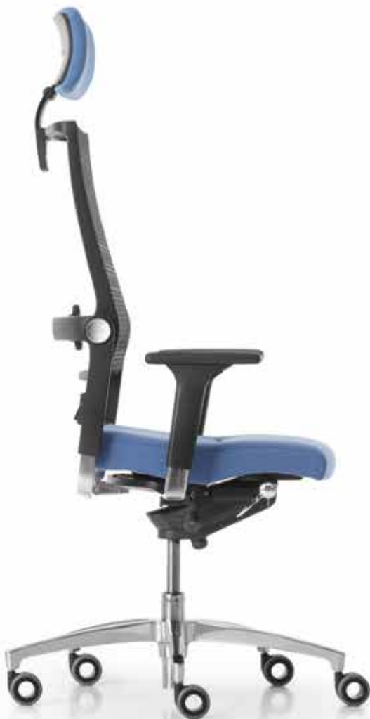
SD LO 3020 + Armlehnen | Armrests A441APO