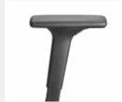
A441KGS (4F) Armauflagen PU soft Armpads PU soft