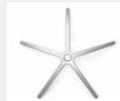
FHAPO Aluminium poliert (Option) Aluminium polished (option)