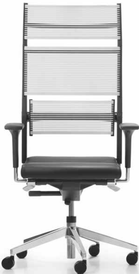
SD LO 3390 + Armlehnen | Armrests A441APO

The elegant seating solution for the executive floor. A great thing to look at – even better to sit on: the Lordo executive swivel chairs come equipped with our patented Syncro-Dynamic Advanced® mechanism, guaranteeing comfortable and constant body support. Both seat and backrest follow the user's natural way of movement, including keeping one's legs in a comfortable position at all times.