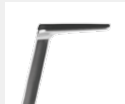
AS06APO Armauflagen PU soft Armpads PU soft

*mit antibakterieller Mikrosilberausrüstung zum Schutz vor Infektionen with antibacterial microsilver finish to help prevent infections