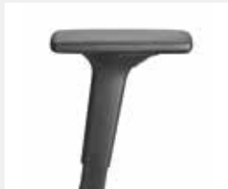
A241KGS (2F) Armauflagen PU soft Armrests PU soft