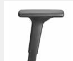
A441KGS (4F) Armauflagen PU soft Armrests PU soft