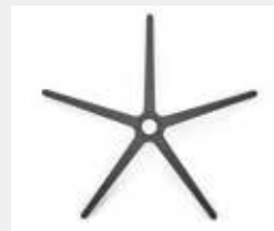
FHKGS Kunststoff schwarz (Standard) Black plastic (standard)