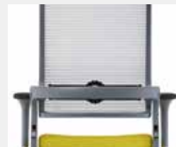
Eisengrau (RAL 7011) Iron grey (RAL 7011)