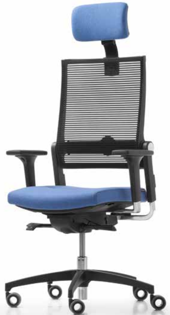
QS LO 3027 + Armlehnen | Armrests A441APO