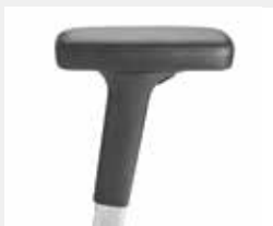
A442APO (4F) Leder-Armauflagen Leather armrests