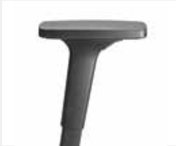
A240KGS (2F) Armauflagen PU Armpads PU