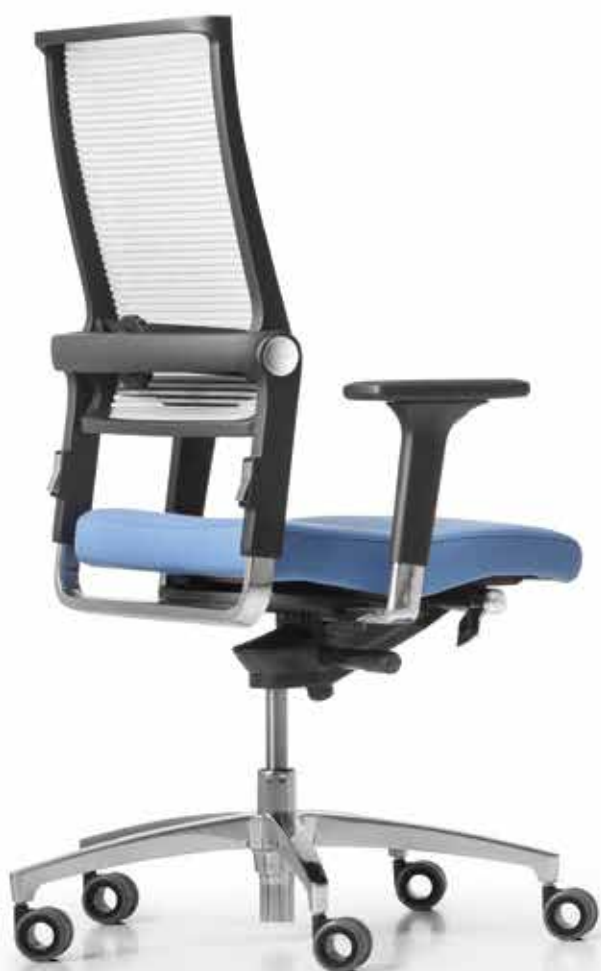
SD LO 3010 + Armlehnen | Armrests A441APO