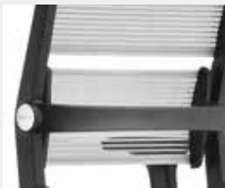
Lordosenstütze, pendelnd gelagert Lumbar support, swing-mounted