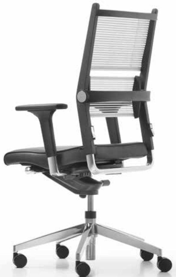
SD LO 3380 + Armlehnen | Armrests A441APO