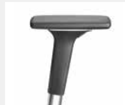
A541APO (5F) Armauflagen PU soft Armpads PU soft