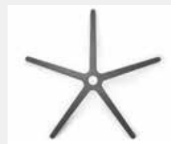
FHKEG Kunststoff eisengrau (Option) Plastic iron grey (option)