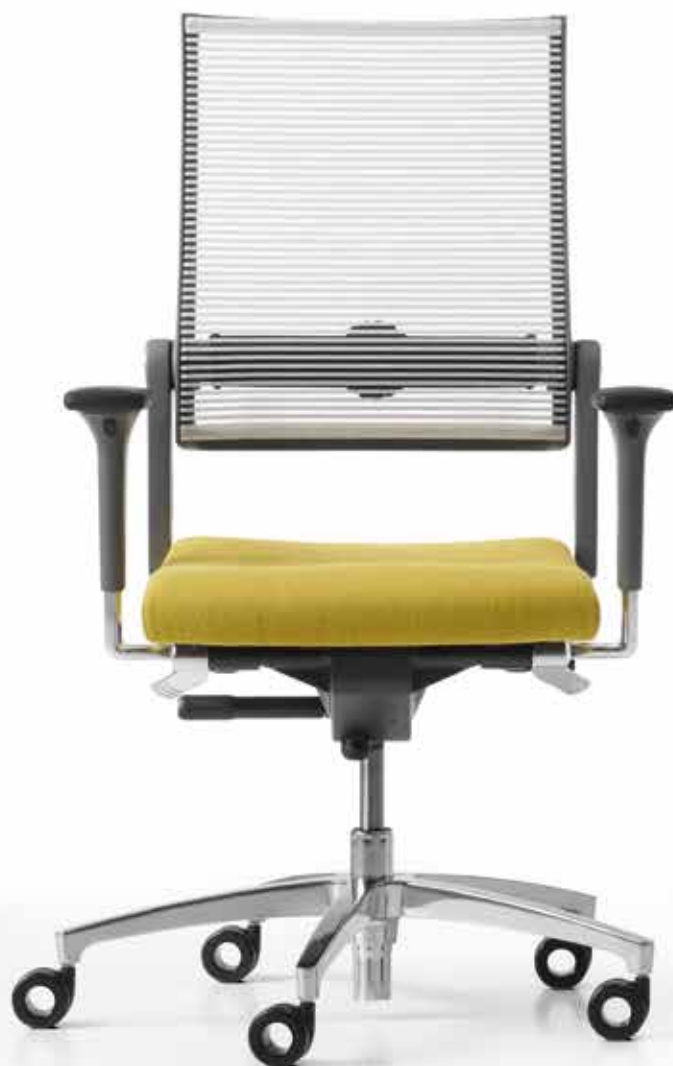
SD LO 3010 + Armlehnen | Armrests A441APO