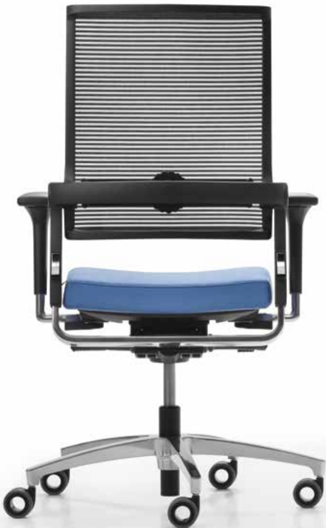
QS LO 3017 + Armlehnen | Armrests A441APO

No matter if you pick a model with or without a neckrest, our Lordo swivel chairs with Syncro-Quickshift® mechanism adapt to the user's natural movement – in perfect harmony. The three-position seat-tilt and seat-depth adjustment combined with four-position synchronised movement enable a healthy and fully ergonomic way of working.