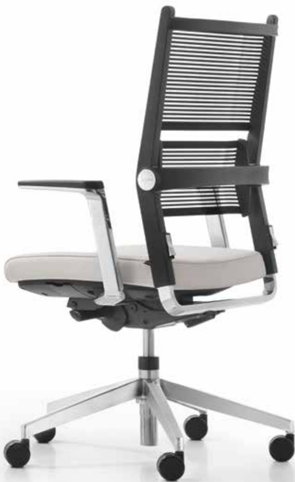
AS LO 3360 + Armlehnen | Armrests AS06APO

Visitor and conference chairs perfectly complete the Lordo product range. Their modern design and fully flexible mesh fabric backrest will be a true asset to both your guests and colleagues. There are a lot of functional options to pick from: The cantilever chairs are stackable, and the height-adjustable conference chairs are available with either gliders or castors.