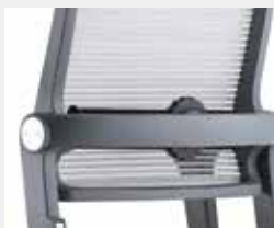
Lordosenstütze tiefenverstellbar (3,5 cm) Lumbar support depth-adjustable (3,5 cm)