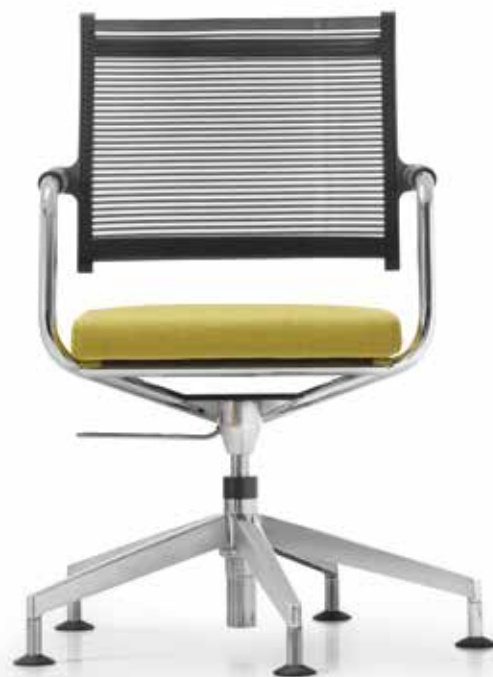
LO 3307 Armauffagen (PA) | Armpads (PA) AA01KGS