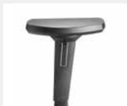
A618KGS (6F; NPR) Armauflagen PU soft Armrests PU soft

Farbe der Armlehnenhülse = Modellfarbe Colour of armrest cover = model colour