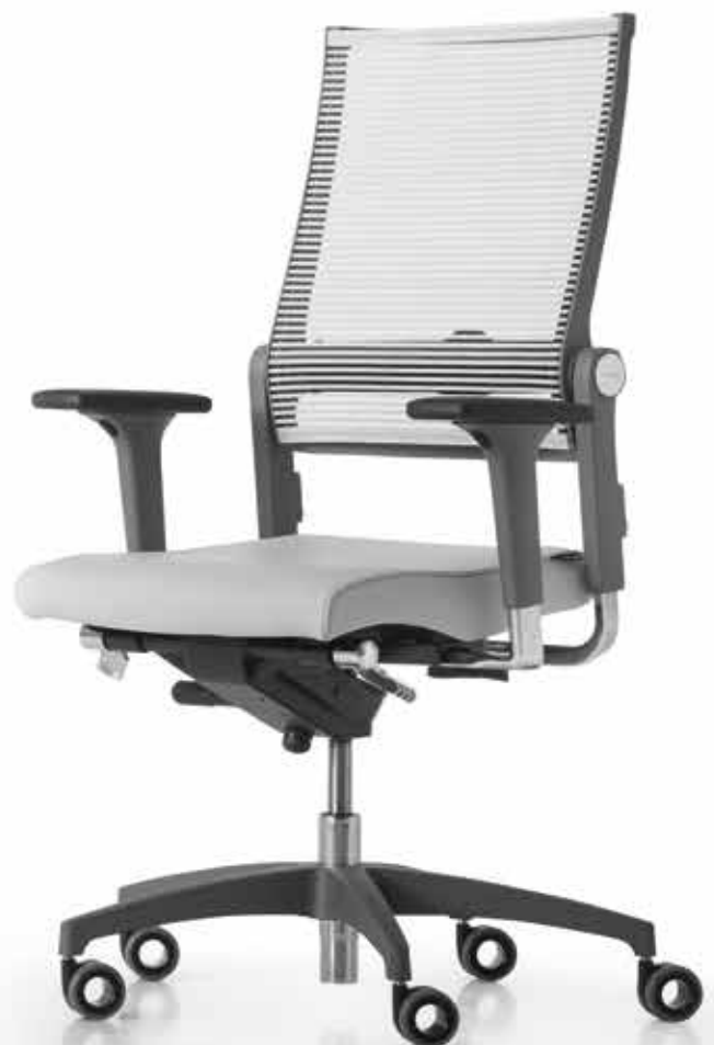
SD LO 3010 + Armlehnen | Armrests A441APO