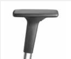
A441APO (4F) Armauflagen PU soft Armpads PU soft